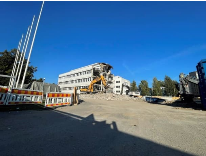
Kuva 1 ja 2. Oikeustalon laajennusosan pohjan valmistelutyöt käynnissä.