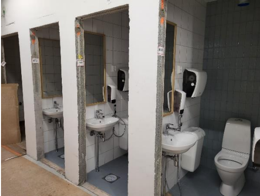
Kuva Vesikaluste ja varusteasennuksia