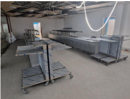
Kuva ruokalan jakelulinjasto