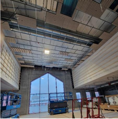
Kuva Ruokalan alakattoasennuksia