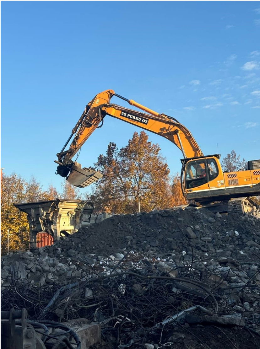
Kuva 3. Työmaan murskaamossa tehdään MARA-murskettä.