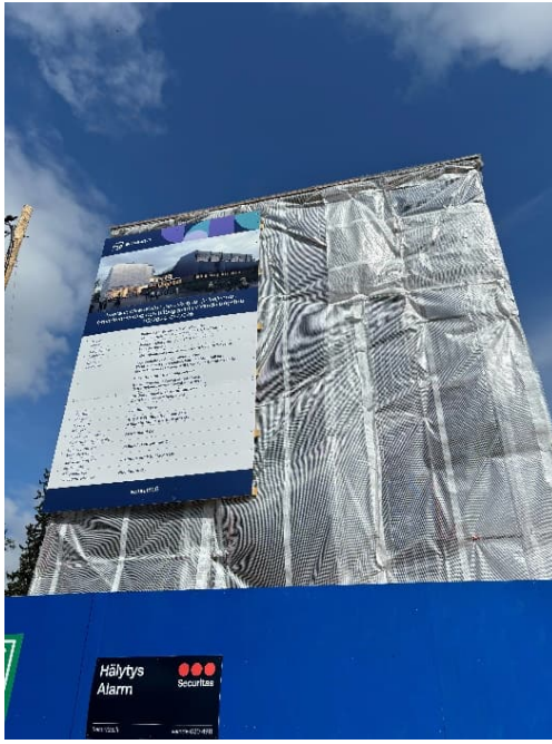
Kuva 4. Työmaan työmaataulu parakkien seinällä