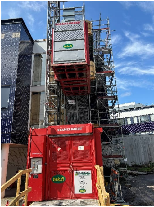
Kuva 3. Työmaahissi