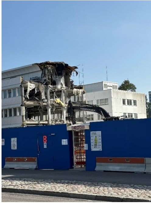
Kuva 1 ja 2. Poliisitalon purkutyöt käynnissä.