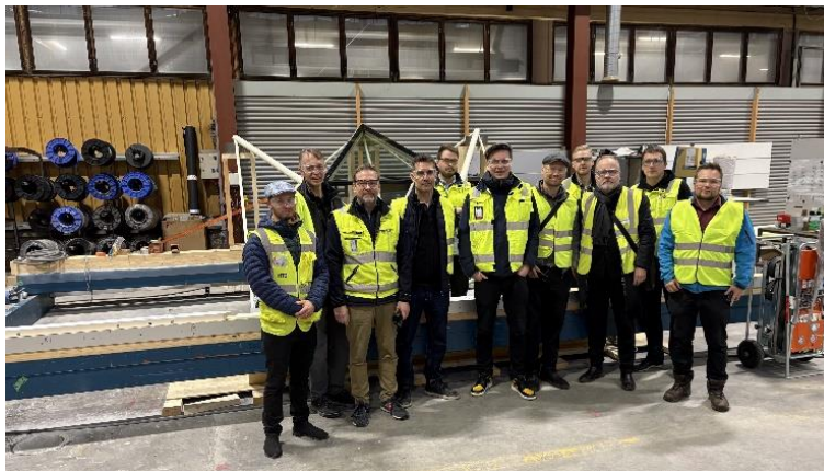
Kuva 5. Mallikatselmustiimi.

Suomen Kansallismuseon peruskorjaushankkeen yhteydessä, museon vanha pohjoinen sisäpiha katetaan ja muutetaan sisätilaksi. Halkopiha tulee toimimaan yleisön kulku- ja aulatilana, sekä tapahtumapaikkana.