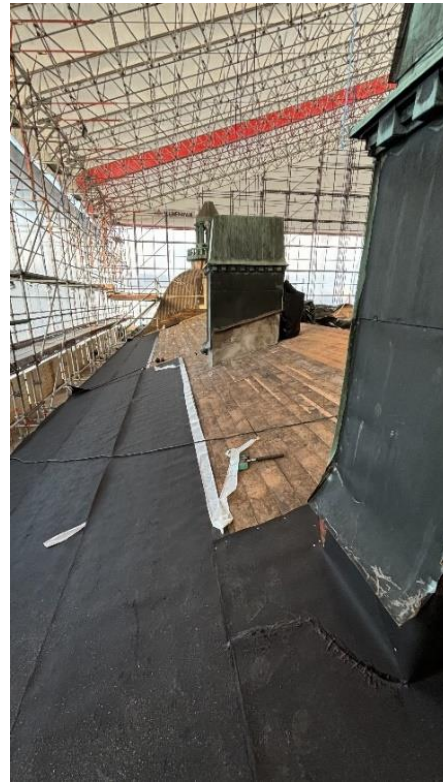
Kuva 3. Aluskerman asennusta virastosiiven länsilapelle.