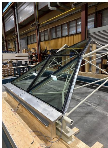
Kuva 10-11. Halkopihan lasikatteen mallin rakenteiden tarkastelua ja valmis malli.