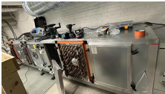
Kuva 2. IV-koneiden asennustöitä