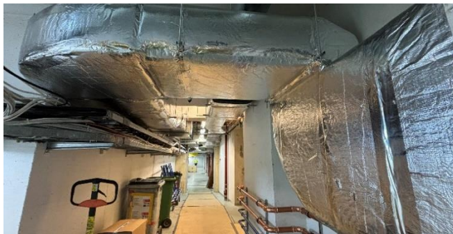
Kuva 4. IV-kavava-asennuksia kellarikerroksessa.