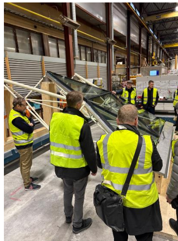
Kuva 6-9. Halkopihan lasikatteen mallikatselmusta.

Lasikaton rakenteita suunniteltaessa on otettu huomioon paitsi sen massiivinen koko, niin myös paloturvallisuus, sekä suomen talven lumikuormat ja vaihtelevat keliolosuhteet.