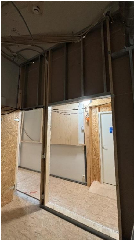
Kuva 3. Väliseinä odottaa tuplausta.