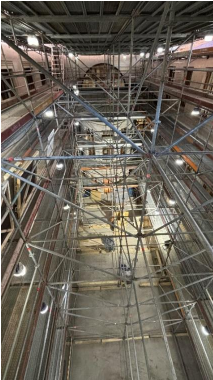
Kuva 2. Halkopihan telineasennukset valmiit.