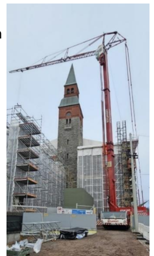
Kuva 1. Vaiheen 1 telineiden kattoristikoiden purkua.