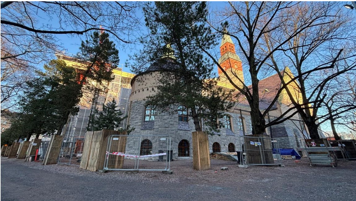
Kuva 7. Museon valmista julkisivua etelään.

Lisätietoa Urakoitsija: NCC Suomi Oy, vastaava työnjohtaja Tuomas Nousiainen, tuomas.nousiainen@ncc.fi 010 507 8232