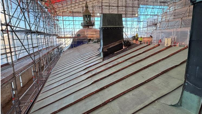
Kuva 6. Kattopellitystä ja räystäspellitystä Virastosiiven länsilapeella.

Kansallismuseon massiiviset sääsuojat valmistuivat ennen joulua ja nyt suurin osa Kansallismuseota on sääsuojan peitossa. Sääsuojan alla työt ovat hyvässä vauhdissa. Siellä suojataan, puretaan, korjataan, ja uudistetaan pintoja ja rakenteita.