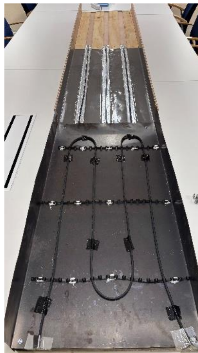
Kuva 4. Halkopihan lasikaton räystäslämmitysmalli.