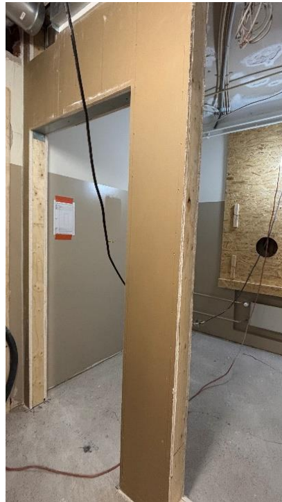
Kuva 2. Sisäseinien tuplausta.