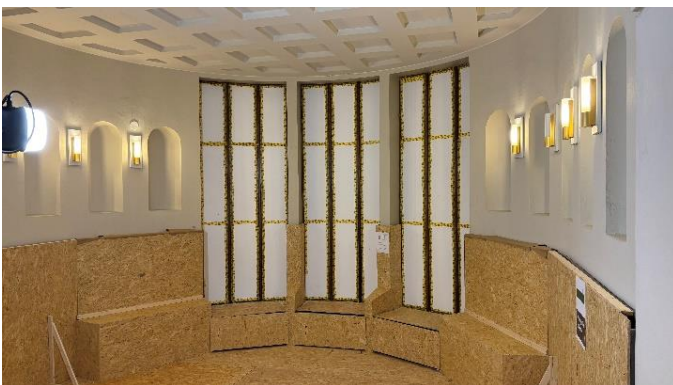
Kuva 3. Pintojen suojausta museon sisäpuolella.

Kansallismuseon peruskorjauksen yhteydessä museon sisäpuolella uudistetaan seinä- ja kattopintoja, mutta kaikkia tiloja ei pintakäsitellä kokonaisuudessaan. Väriyksessä seurataan tilojen edellisessä peruskorjauksessa toteutettua väritystä. Vuosien varrella värisävyt ovat voineet muuttua, joten kaikista sävyistä tehdään ensin maalausmallit, jotka hyväksytetään arkkitehdillä ja Museoviranomaisella. Kartonkimalleja on tehty satoja, koska värisävyjen lisäksi malleissa huomioidaan eri kiiltoasteet. Osaan tiloista tulee erikoismaaleja, kuten pellavaöljymaalit, joista tehdään omat mallinsa. Kansallismuseon ikkunat on suojattu, mikä estää luonnonvalon pääsyn pintakäsiteltäville alueille. Mallikatselmuksia varten onkin tuotu teatterivalaisin, joka toistaa mallien sävyt oikein.