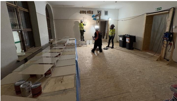
Kuva 1. Maalausmallien tarkastelua.

Kansallismuseon peruskorjauksen yhteydessä museon sisäpuolella uudistetaan seinä- ja kattopintoja, mutta kaikkia tiloja ei pintakäsitellä kokonaisuudessaan. Väriyksessä seurataan tilojen edellisessä peruskorjauksessa toteutettua väritystä. Vuosien varrella värisävyt ovat voineet muuttua, joten kaikista sävyistä tehdään ensin maalausmallit, jotka hyväksytetään arkkitehdillä ja Museoviranomaisella. Kartonkimalleja on tehty satoja, koska värisävyjen lisäksi malleissa huomioidaan eri kiiltoasteet. Osaan tiloista tulee erikoismaaleja, kuten pellavaöljymaalit, joista tehdään omat mallinsa. Kansallismuseon ikkunat on suojattu, mikä estää luonnonvalon pääsyn pintakäsiteltäville alueille. Mallikatselmuksia varten onkin tuotu teatterivalaisin, joka toistaa mallien sävyt oikein.