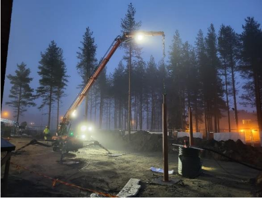
Kuva pyöräkatoksen pilariasennus