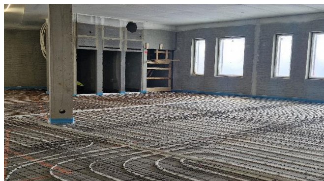
B-lohkon 3.kerros pintaalaan valmistelevia töitä

Liikunta-, urheilu- ja nuorisoministeri Sandra Bergvist on myöntänyt Napsun monitoimitalon urheilukentälle liikuntapaikkarakentamisen avustusta 390 210 euroa. Valtionavustuksia myönnetään laajojen käyttäjäryhmien tarpeisiin