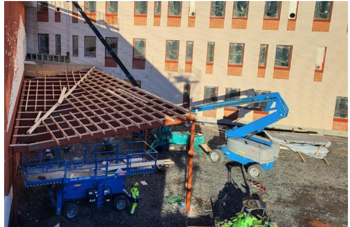
Kuva Pääsisäänkäynnin katoksen työt käynnissä