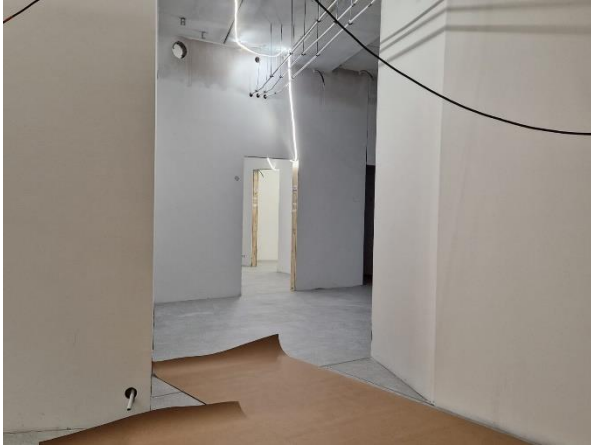
Kuva B- lohkon 3 kerroksen lattiaaatoitusta