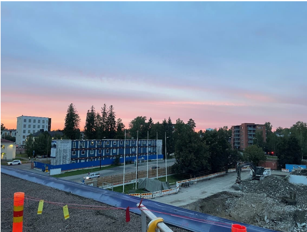
Kuva 2. Koppikylä oikeustalon katolta kuvattuna.