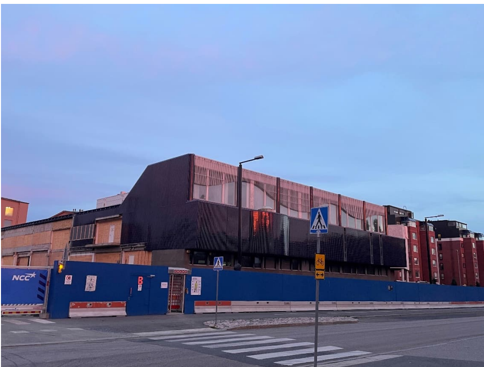
Kuva 3. Oikeustalon julkisivu Kielotieltä kuvattuna.