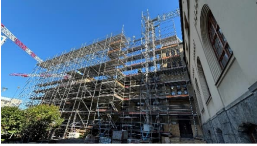
Kuva 4. Telinetöitä länsipuolella.