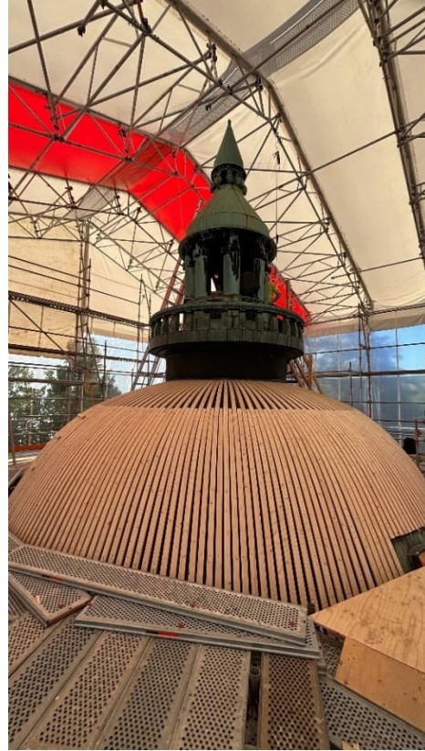
Kuva 7. Rondellin rimoitus valmis ja liuskekivien asennus aloitettu.