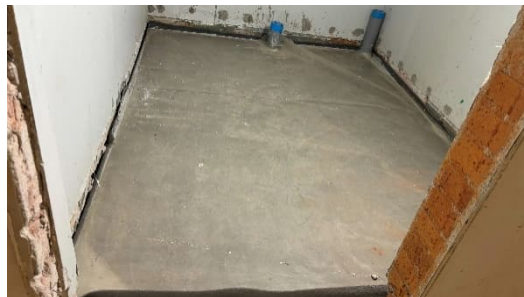
Kuva 9. Lattiavaluja pohjakerroksessa.

Lisätietoa Urakoitsija: NCC Suomi Oy, vastaava työnjohtaja Tuomas Nousiainen, tuomas.nousiainen@ncc.fi 010 507 8232