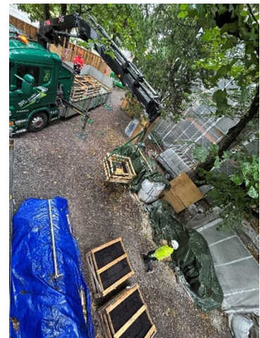
Kuva 3. Työmaalle saatiin uusi erä liuskekiviä.