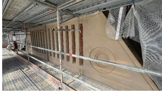
Kuva 5. Rappaus ja maalaustyöt etenevät eteläjulkisivulla.