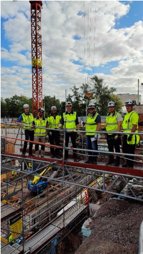
Kuva 8. Pohjoispäädyn telinesuunnittelua yhdessä SRV: n kanssa.