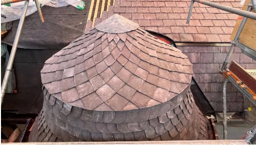
Kuva 6. Pikkurondellin liuskekivetystä.