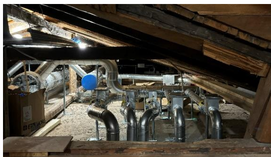
Kuva 8. Uusia ilmanvaihtokanavia ullakkotilassa.