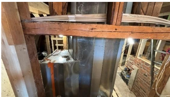
Kuva 6. Sisäänkäynti ullakolle.