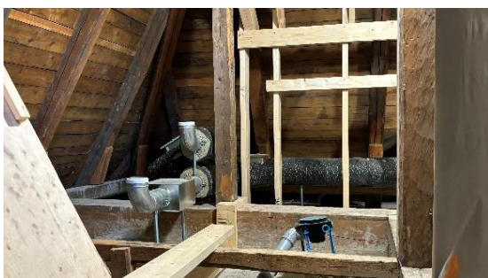
Kuva 7. Uuden konehuoneen puutyöt aloitettu.