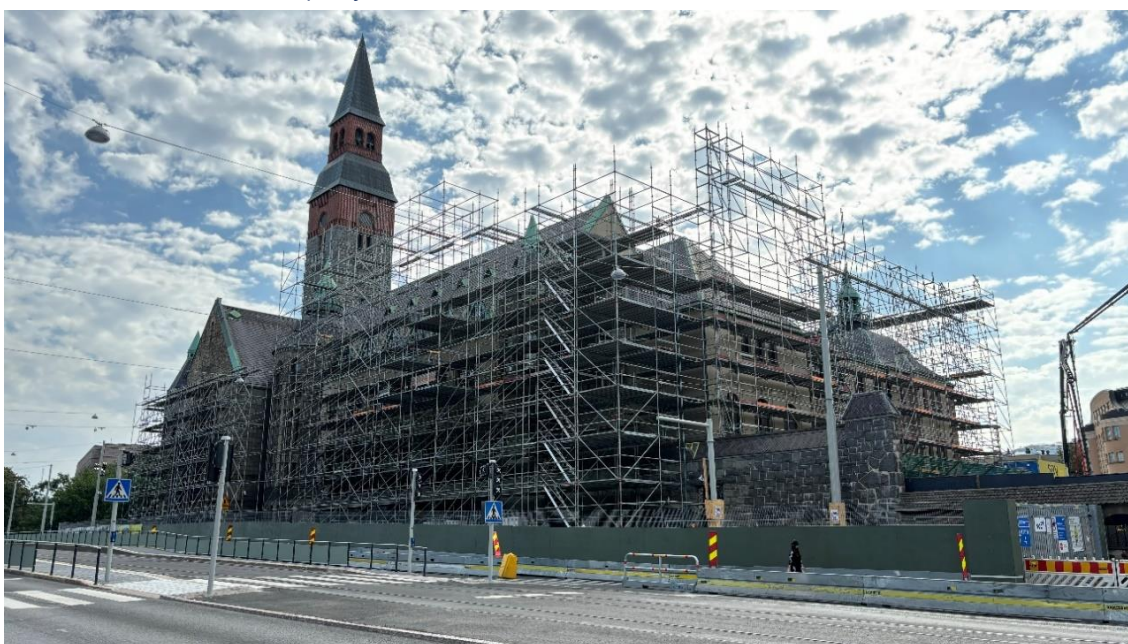
Kuva 9. Telinepystytystä itä- ja pohjoisjulkisivuilla.

Lisätietoa Urakoitsija: NCC Suomi Oy, vastaava työnjohtaja Tuomas Nousiainen, tuomas.nousiainen@ncc.fi 010 507 8232