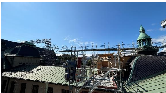
Kuva 5. Töiden aikainen sisäänkäyntikatos ullakolle. Taustalla näkyy länsipuolen telineasennuksia.

Virastosiiven torniin rakennettavan uuden IV-konehuoneen työt ovat edenneet aikataulussa. Ullakolla on ahdasta ja välillä kuumaakin, mutta asentajat ovat jo saaneet vedettyä uusia putki- ja ilmanvaihtolinjoja. Myös uuden konehuoneen puutyöt ovat käynnissä.