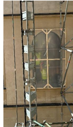
Kuva 1. Ikkunasuojausta.